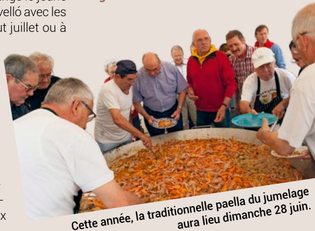
Cette année, la traditionnelle paella du jumelage aura lieu dimanche 28 juin.