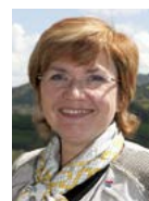
Angélique Delahaye Député européen et maire de Saint-Martin-le-Beau

** Syndicat intercommunal d'énergie d'Indre-et-Loire