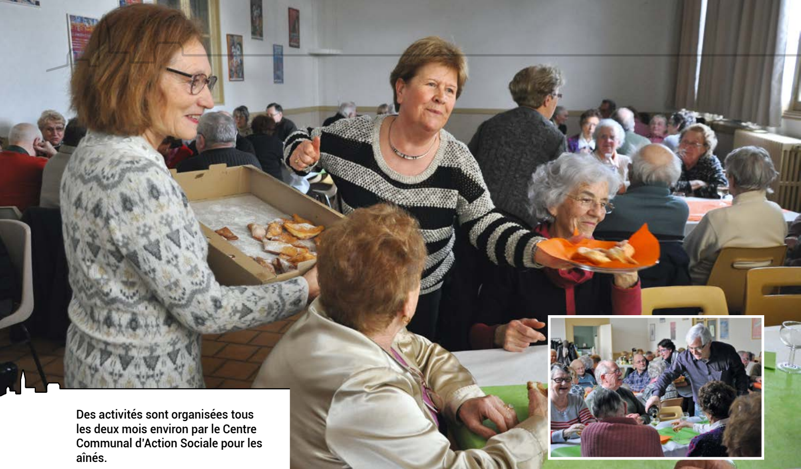
Des activités sont organisées tous les deux mois environ par le Centre Communal d'Action Sociale pour les aînés.