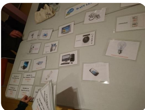
La Watt Ligne